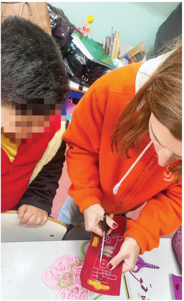
...fizemos máscaras de Carnaval e...