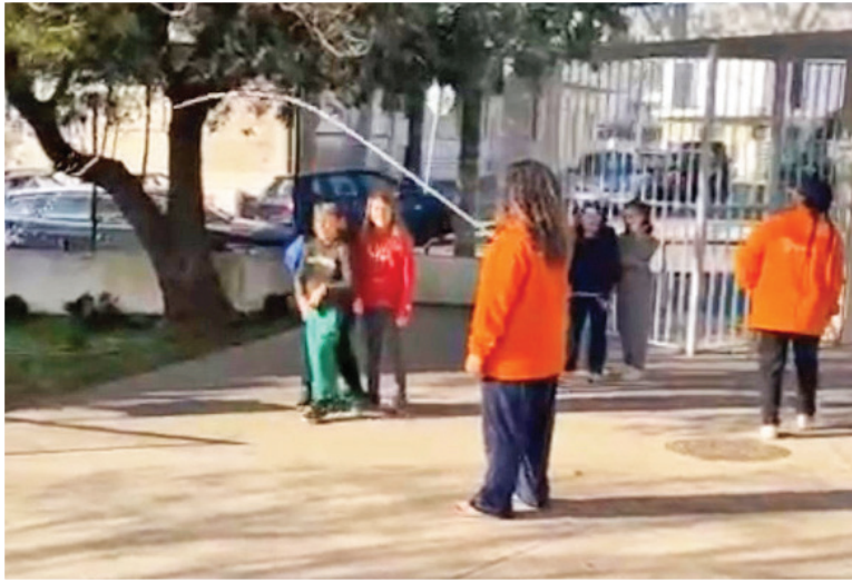
ATELIER DE BRINCADEIRA LIVRE A imaginação é o principal motor